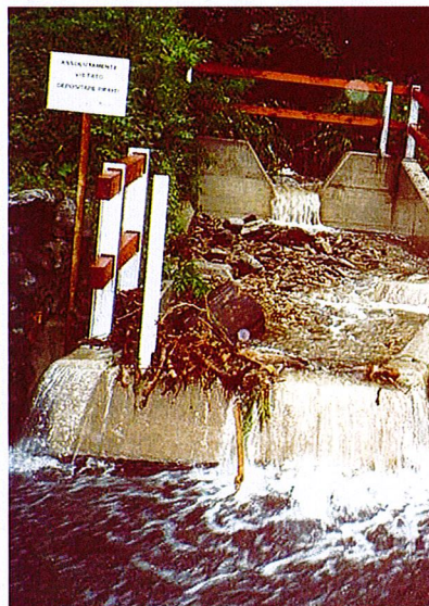
Camera riempita presso via ai Ronchi