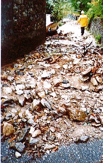
Via alla Chiesa