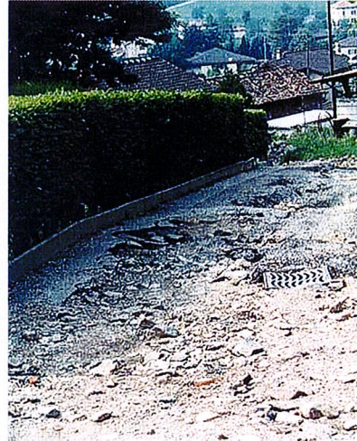
Via ai Ronchi

Come evidenziato dallo Studio di dettaglio e dalle fotografie, si rileva la propensione a generare trasporto solido per i corsi d'acqua del comprensorio, in particolare per quelli lungo la sponda destra del Vedeggio.