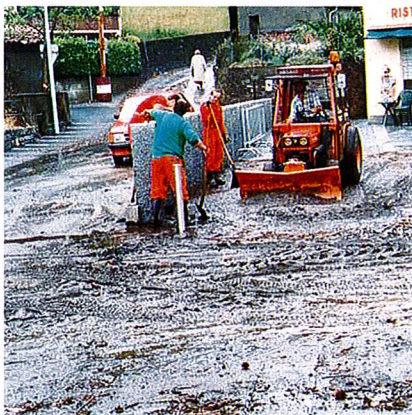
Piazza du Buteghin, nucleo di Mezzovico

Riportiamo inoltre alcuni esempi significativi di quanto è avvenuto durante gli eventi piovosi del 1997 e 1988.